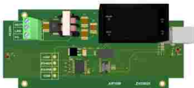
Рис. 2. Печатная плата БПТ-Ц-24-485

В центре печатной платы установлен светодиод индикации состояния работы преобразователя: Постоянный свет – рабочий режим.