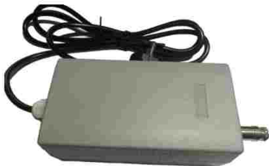
Рис. 1. Преобразователь интерфейса с блоком питания БП-Ц-24.485

В паспорт руководства по эксплуатации время от времени вносятся изменения, которые будут отражены в следующих изданиях. В связи с постоянным совершенствованием оборудования могут быть внесены незначительные изменения, не отраженные в паспорте.