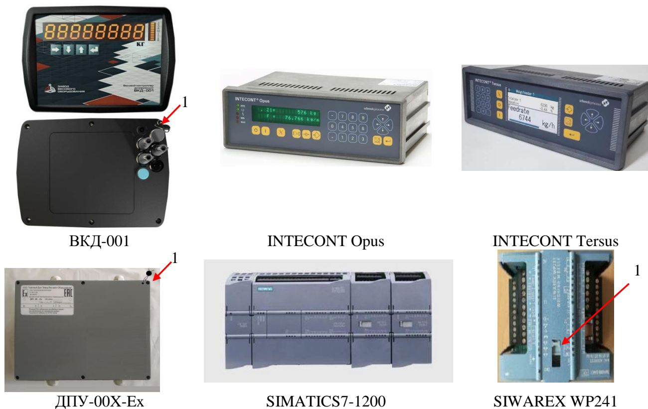
Рисунок 2 — Общий вид и схема пломбировки электронных устройств средства измерений от несанкционированного доступа (1 – место пломбировки)

Средства измерений выпускаются в модификациях, отличающихся метрологическими и техническими характеристиками в соответствии с таблицами 3, 4. Обозначение модификаций средства измерений имеет вид: ЛДНД-[1]-[2]-[3], где: