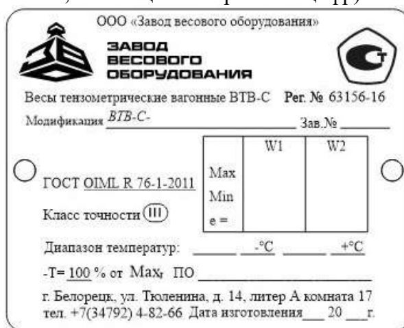
Рисунок 3 – Общий вид маркировочной таблички однодиапазонных (слева) и многодиапазонных (справа) весов