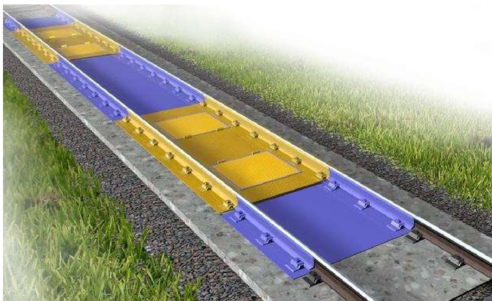
Рисунок 1 – Пример общего вида ГПУ весов